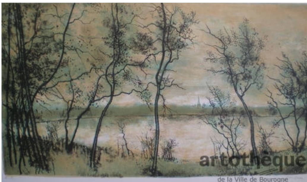
L'étang des Forges - 1961