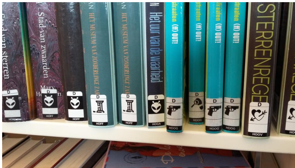
La Bibliothèque nationale des Pays-Bas.

A noter une autre particularité du fonctionnement des bibliothèques néerlandaises : la vente, en continu, des documents sortis des collections est une pratique largement répandue, ce qui n'est pas le cas dans nos bibliothèques où cela reste plus rare et généralement lié à un événement exceptionnel (braderie annuelle...).