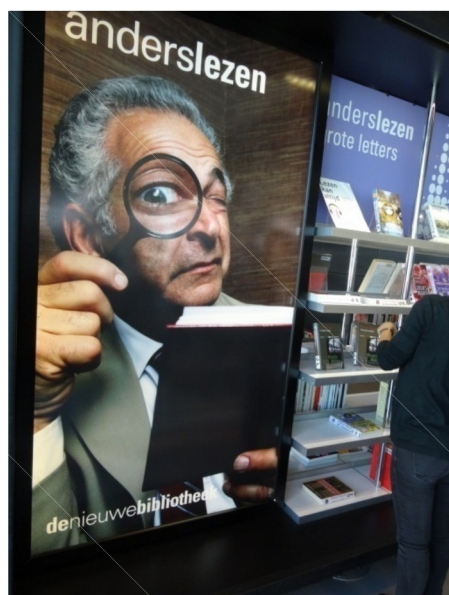
Les livres en gros caractères, c'est ici !