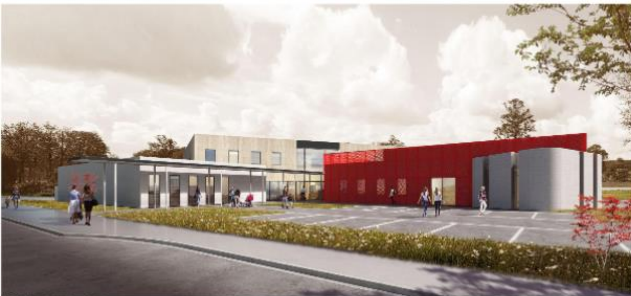
PC6 - insertion dans le site